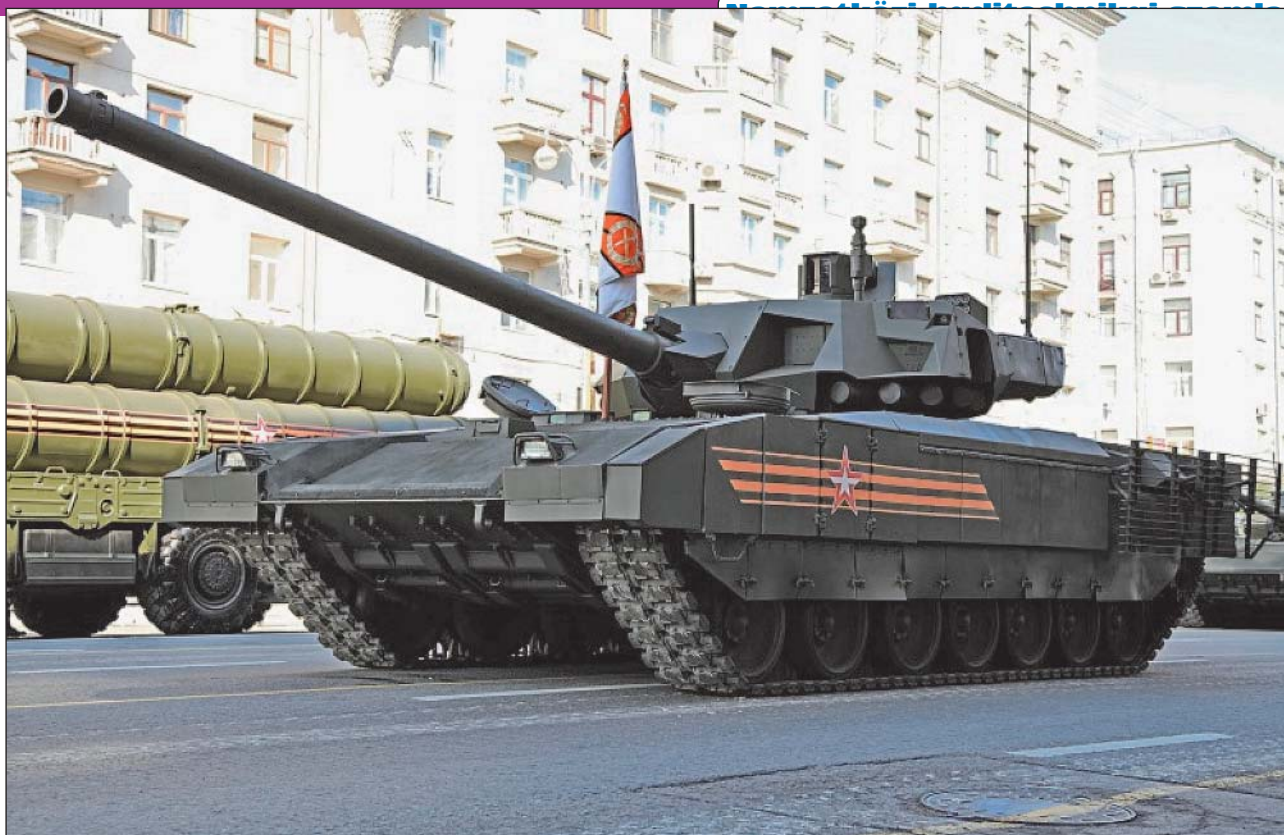
6. ábra. T-14 Armata harckocsi a 2015-ös díszszemlén

egyébként is elavult eszközt [2., 160 o.]. Ezt a típust végül nem is rendszeresítették, de a német Panzer IV-eseket pl. viszonylag nagy számban korszerűsítették ilyen módon, így a szintén elavult konstrukciót a háború végéig tudták alkalmazni. Szükség is volt a teljes oldalkötényzetre, ami javította a védettséget, főleg a háború vége felé az amerikai M1–M25 páncéltörő rakétavető-család (közkeletű nevén Bazooka) M6/M7 típusú rakétagránátja ellen. A már említett tömegnövekedésen kívül az előtétek megnövelik a harckocsi befoglaló méreteit. A fenti nehézségek miatt napjainkban sem minden esetben használják ezt az eljárást, de az új harckocsik mellett a több évtizedes típusok üzemidejének kitolására nem egy esetben szerelnek fel ilyen elemeket a kritikusabb helyeken, emellett a lánckötnyezés az újabb típusoknál (és a lövészpáncélosokon is) gyakorta előfordul.