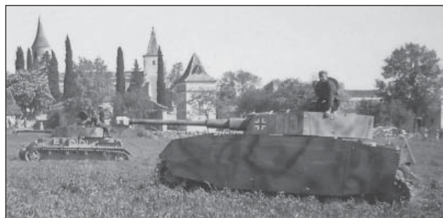
5. ábra. Panzer IV-es kiegészítő páncélzattal az előtérben, és hátul, páncélzat nélkül

Történelmük során először vált tehát szükségessé a harckocsik védelmének jelentős újragondolása, és valamilyen szokatlan, új módszer kitalálása. Az első ilyen kísérlet az ún. „kötény” vagy előtétpáncélzat alkalmazása a kumulatív lőszerrel azon elvére épít, hogy maga a kumulatív sugár véges hosszúságú. Tehát ha sikerülne elérni, hogy a töltet a páncéltörő előtt robbanjon néhány cm-rel, akkor az már nem lenne képes átútni a teljes páncéltreteget [9., 44 o.]. Maga az elv nem annyira új, a II. világháborúban viszonylag gyakran alkalmazták ezt a módszert a gyorsan avuló harckocsik alkalmazhatóságának meghosszabbítására. A módszer iskolapéldája a magyar 44M „nehéz” Turán harckocsi. Ugyanakkor változatlan motorteljesítmény mellett ez legalább 10%-kal növelte a volna harckocsi harci tömegét, így lényegében teljesen megbénítva az