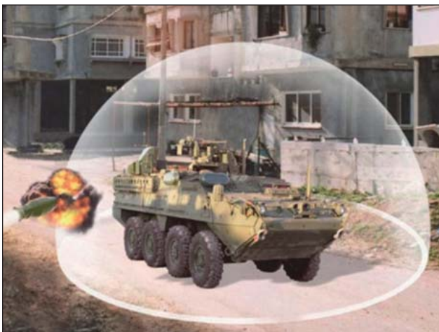
1. ábra. Egy grafikus ábrázolás az APS működéséről

sel párhuzamosan) jelentősen csökkentette a páncélosaik számát az utóbbi időben [4.]. Azonban feltételezhető, hogy az ilyen lépések mögött a békeidőben óhatatlan költségcsökkentési megfontolások állnak csupán, és valójában egyetlen korszerű hadsereg sem engedheti meg magának a harckocsik teljes mellőzését.