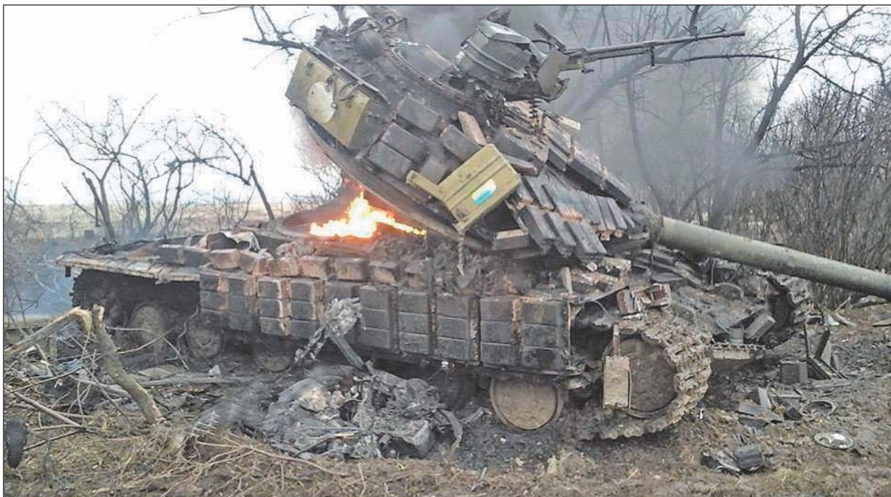
2. ábra. Az ukrajnai harcok során kilőtt T-64-es a reaktív páncélzat jellegzetes tégláival

tén a tüzérség az ellenséges védművek és a gyalogság pusztítására alkalmas lőszerrel, repesz-romboló gránátokkal tüzelt [6., 18 o.], méghozzá elég nagy távolságból, hogy az ellenséges tüzérségi tűz őket lehetőleg már ne érhesse el. Miután a harckocsik kezelőszemélyzete biztonságban volt a gránátok repeszhatásától is, így igazából csak egy kellően nagy űrméretű fegyverből leadott közvetlen találat volt képes biztosan elpusztítani őket, amihez viszont az ágyúkat előre kellett vonni az első vonalba.