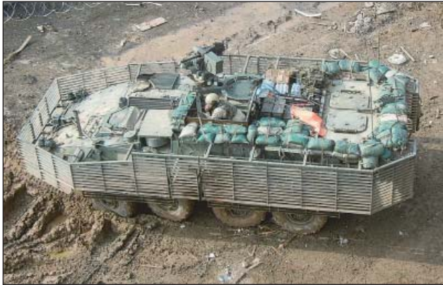
7. ábra. Kumulatív löszerek elleni védőrács (Slat-armor) alkalmazása Afganisztánban, egy amerikai Stryker harcjárművön

mára is könnyen hozzáférhető RPG-k segítségével is érzékeny veszteségeket okoztak a már reaktív páncélzattal is felszerelt orosz harckocsiknak. A módszerük az volt, hogy gyors egymásutánban több rakétát is kilőttek ugyanarra a célpontra. Az első találat „letakarította” az adott felületről a reaktív tölteteket, majd a második már a csupasz páncélt testet érte [12]. Ezt a taktikát terroristák és lázadók máig előszeretettel alkalmazzák.